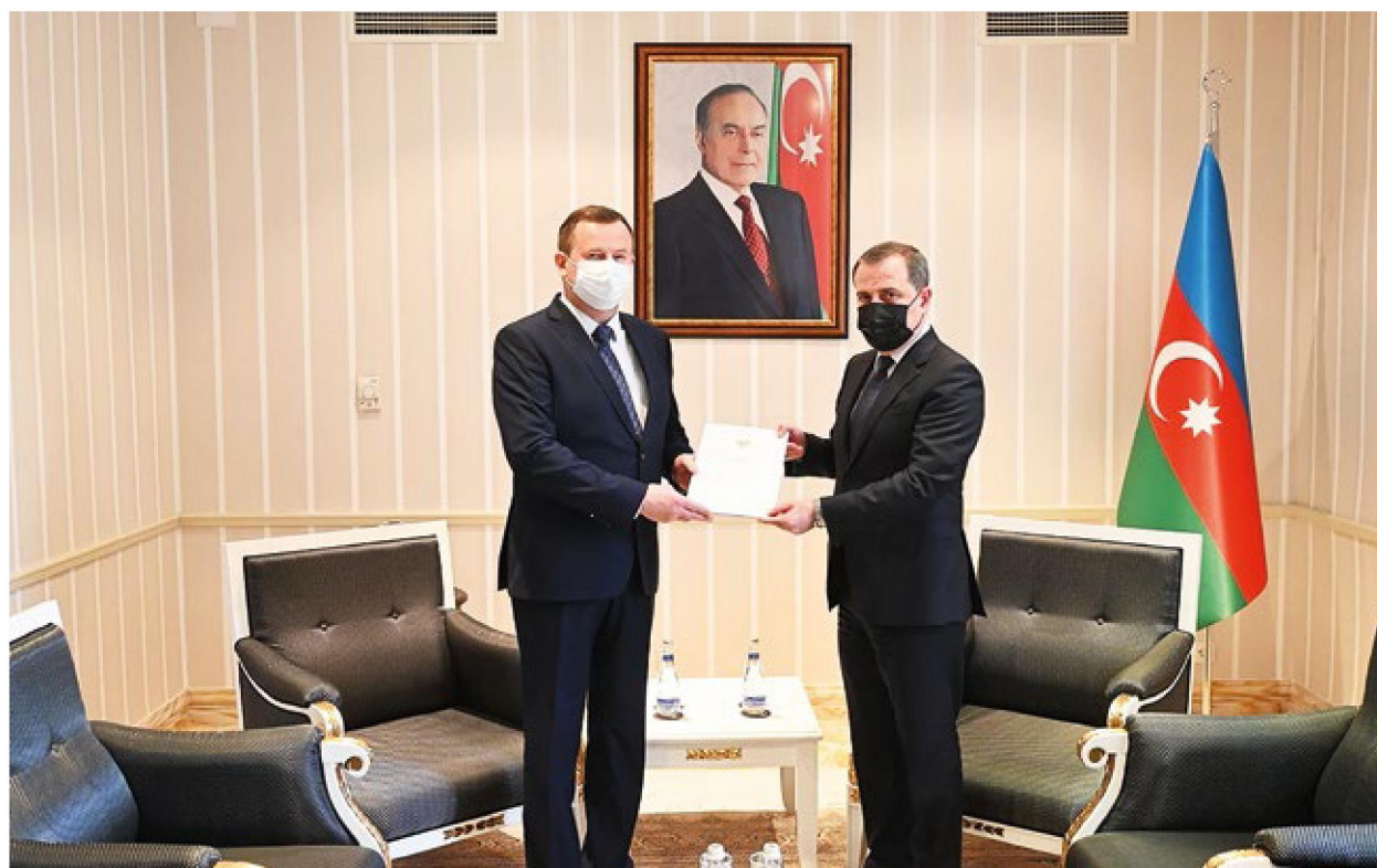
Вручение копий верительных грамот Министру иностранных дел Азербайджанской Республики Джейхуну Байрамову, 29.01.2021 г. Баку

In the fight against Nazism, the inhabitants of Azerbaijan have shown valour and selflessness, in the rear, too. Azerbaijani workers who worked in the oil-bearing lands, according to many experts, covered more than 80% of the fuel and oil needs of the army during the war. It is true that cavalry and horse transport were used in the warfare, but actually it was a war of motors.