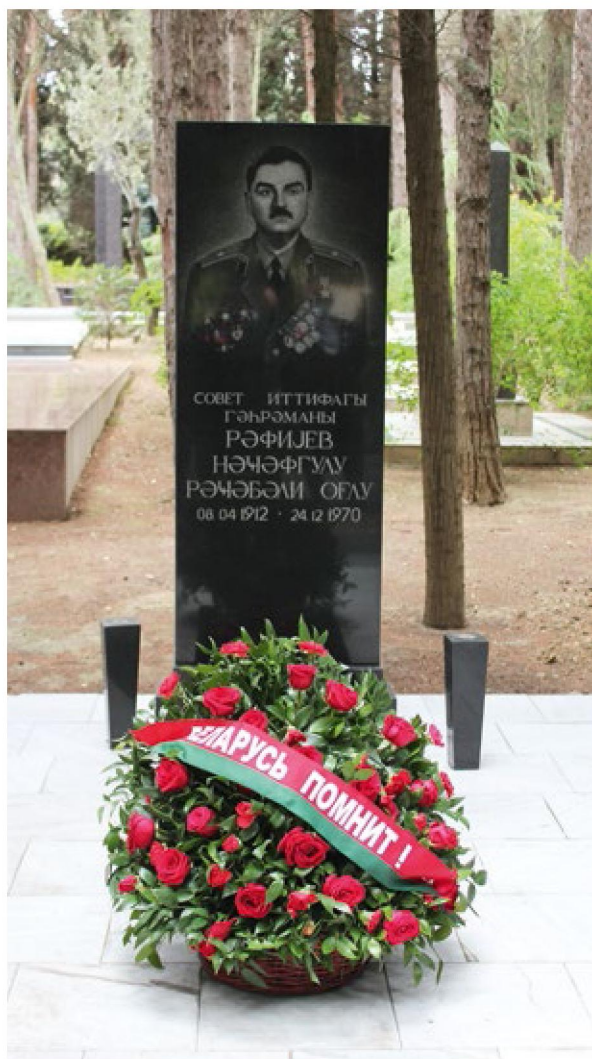
Захоронение Наджафгулу Рафиева, командира танкового взвода в годы Великой Отечественной войны, Героя Советского Союза на Аллее почётного захоронения в г. Баку

За это время я побывал в возвращенных районах Азербайджана: Джебраильском, Зангиланском, Физулинском, Губадлинском и Лачинском, посетил Агдам и Шушу. Эти поездки были организованы Министерством иностранных дел Азербайджана