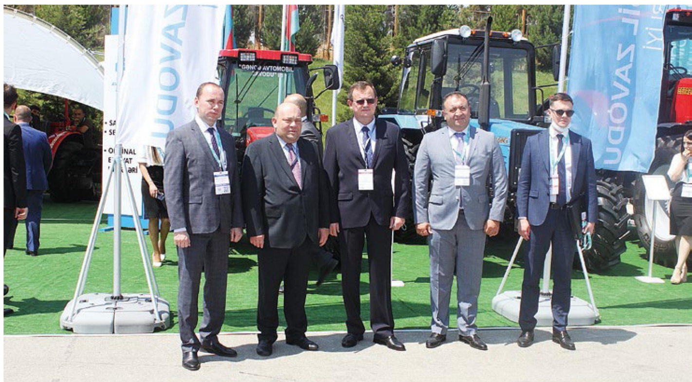
С руководством Гянджинского автомобильного завода на выставочном стенде 14-й Азербайджанской международной выставки «Сельское хозяйство» Caspian Agro 2021 в г. Баку, июнь 2021 г.