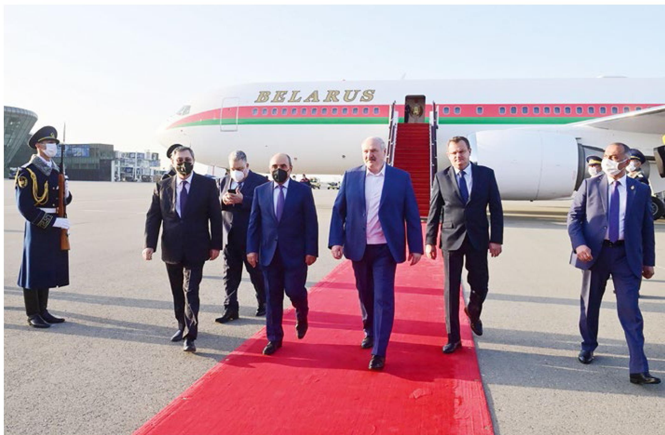
Прибытие Президента Республики Беларусь А.Г. Лукашенко с рабочим визитом в г. Баку 13.04.2021