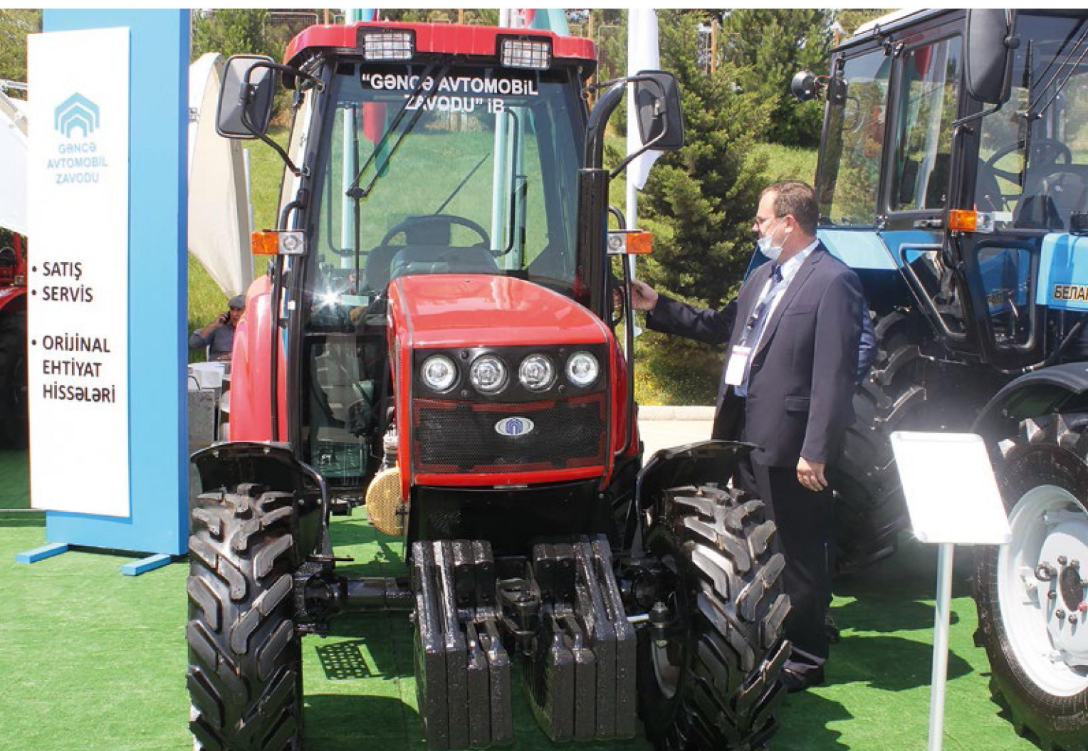
Стенд белорусской техники, собранной на Гянджинском автомобильном заводе, на 14-й Азербайджанской международной выставке «Сельское хозяйство» Caspian Agro 2021 в г. Баку, июнь 2021 г.

— Ganja Auto Plant is the flagship of cooperation between our countries. Since 2007, the enterprise has assembled more than 12 thousand Belarusian tractors, as well as about 3.5 thousand MAZ-, AMKODOR-, Belkommunmash- and Gomselmash-branded machines. Belarus is going to deliver about 1,300 tractor kits this year, which is rather a fine figure actually. The recovery of production scope of other Belarusian machinery is underway, too. The design of introducing joint products