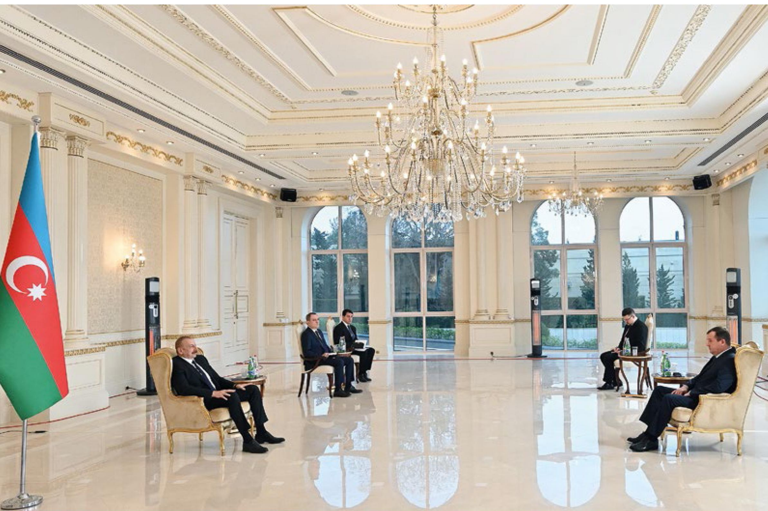
На церемонии вручения верительных грамот Президенту Азербайджанской Республики Ильхаму Алиеву, 16.02.2021 г. Баку

Беларусь и Азербайджан связывают общие интересы по широкому спектру вопросов, у двух стран много схожих черт — от межрелигиозной и межнациональной толерантности общества до стремления к динамичному развитию суверенных и независимых государств, построению социально ориентированных экономик, обеспечению высоких темпов экономического роста. Все это нас также объединяет и пробуждает у сторон созидательный интерес к поддержанию динамичного всестороннего диалога на долгосрочной основе.