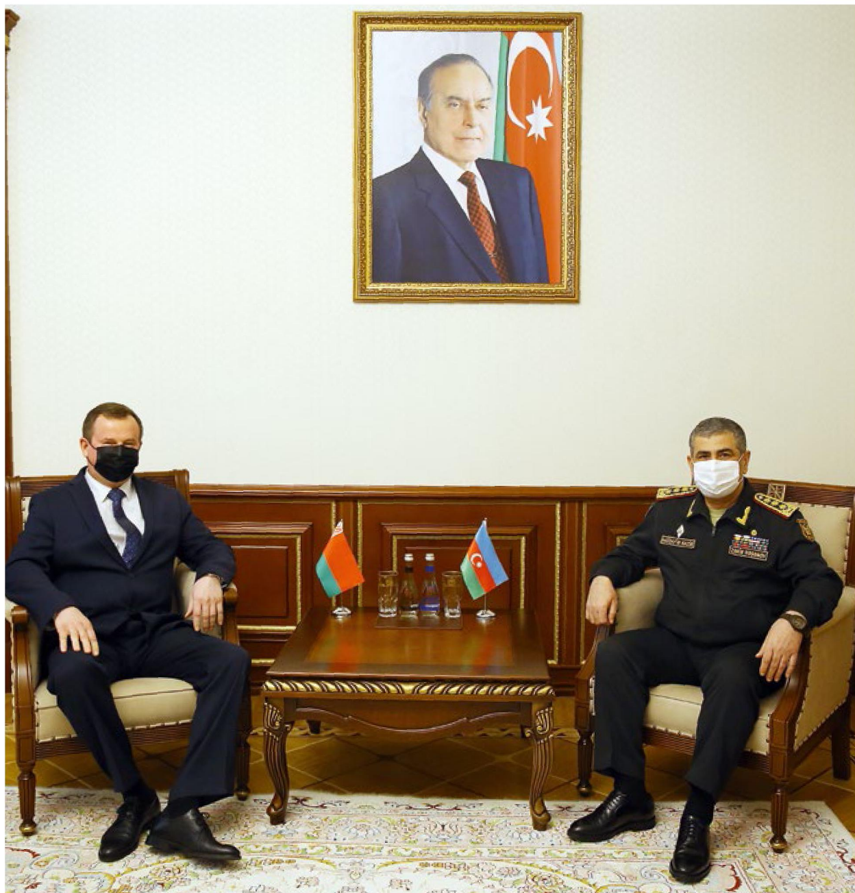
Встреча с Министром обороны Азербайджанской Республики Закиром Гасановым